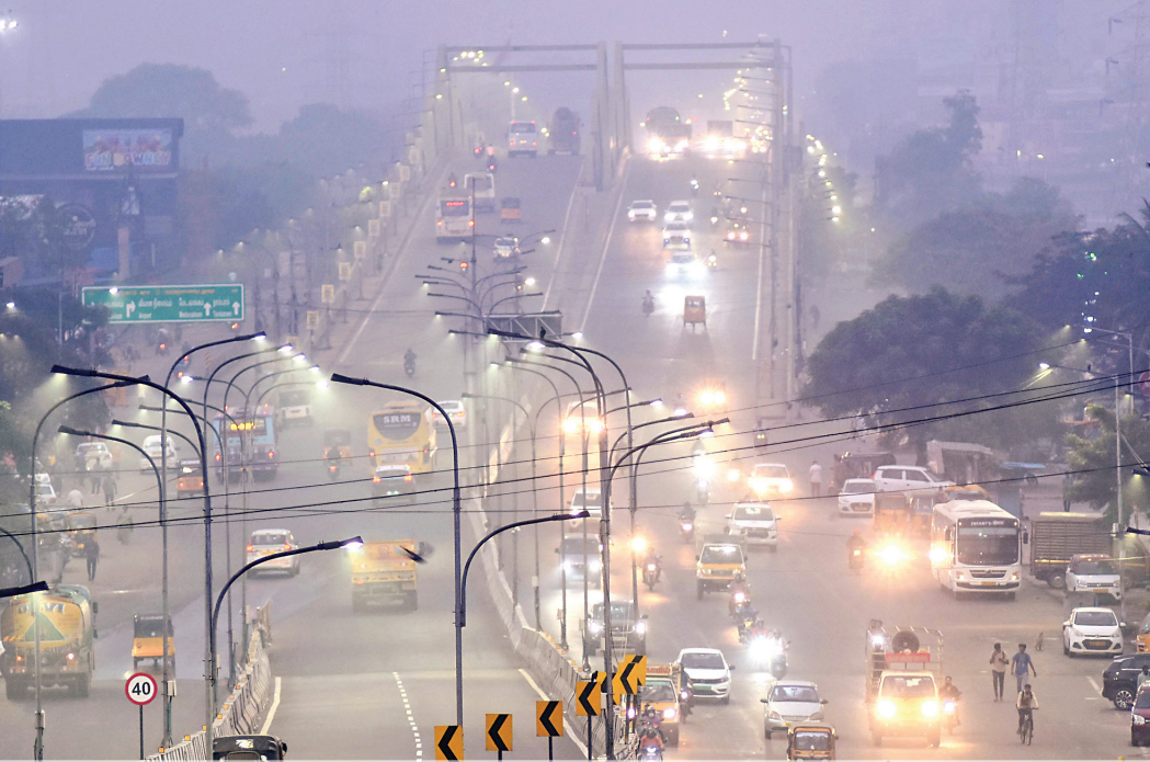
சென்னை வேளச்சேரி மேம்பாலத்தில் புதன்கிழமை காலையில் நிலவிய மூடுபனியால் முகப்பு விளக்குகளை எரியவிட்டுச் சென்ற வாகனங்கள்.

அதன்படி, சென்னை கடற்கரையில் இருந்து இரவு 9.50-க்கு புறப்படும் ரயில் இரவு 10 மணிக்கும், இரவு 10.20-க்கு புறப்படும் ரயில் இரவு 10.30-க்கும் புறப்பட்டு வேளச்சேரி சென்றடையும். மறுமார்க்கமாக வேளச்சேரியில் இருந்து இரவு 10.27-க்கு புறப்படும் ரயில் இரவு 10.37-க்கு புறப்பட்டு கடற்கரையை சென்றடையும் எனத் தெரிவிக்கப்பட்டுள்ளது.